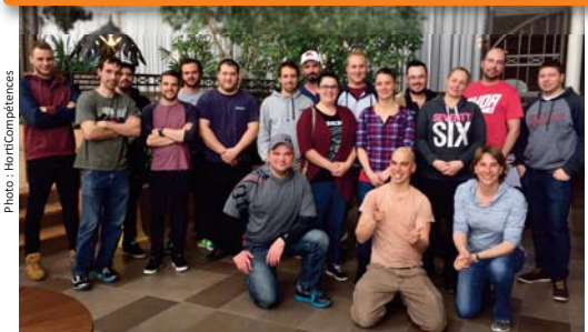
Cohorte de Lévis | 3 au 14 avril 2017

Depuis 2015, 62 ouvriers ont été formés!