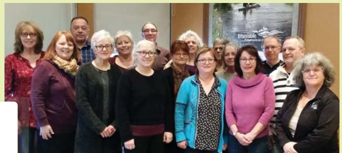
Cohorte 2017 | 28, 29 & 30 mars 2017

Depuis 2005, 240 candidats ont été formés et jumelés à plus de 140 entreprises!